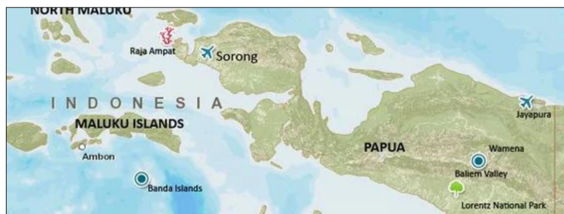
Equipos de rescate. Siguen buscando a posibles sobrevivientes.

Arafah agregó que la mala comunicación dificultó la coordinación entre los rescatistas.///