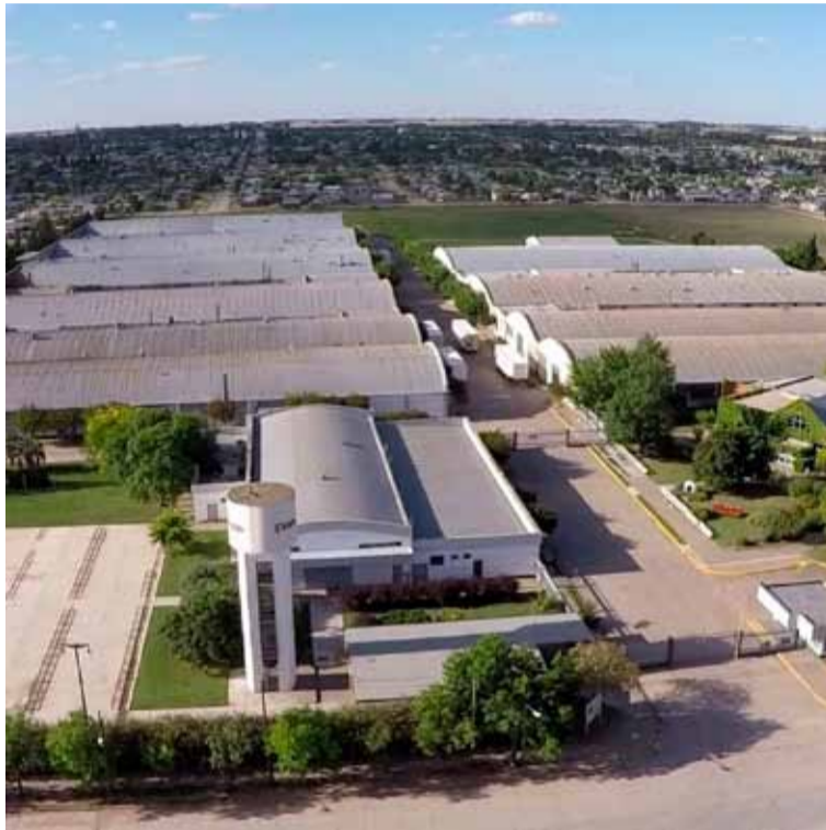
Trabajadores. Se enfrentan a una difícil situación en Coronel Suárez

Según explicó, a comienzos del año pasado la compañía que tiene varias sedes en Brasil tenía 900 trabajadores en la planta de Suárez, pero en la actualidad rondaban los 360. “No es un puesto de trabajo, es toda una comunidad que se cae, y la empresa nunca tuvo problemas económicos, cumplió con los pagos mensuales y sueldos que iban de 800 mil pesos a más de un millón”, agregó.