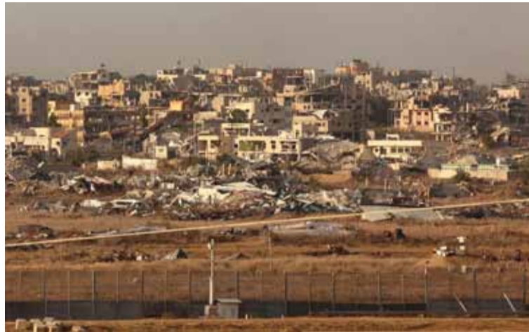
La violencia. Genera una nueva crisis humanitaria en la región.

En el sur de Gaza, dos personas murieron y otras dos quedaron heridas en un ataque aéreo israelí contra una reunión palestina en Khirbet al-Adas, en el norte de la ciudad de Rafah, añadió Basal.