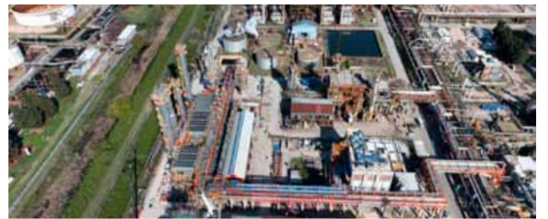
La Refinería de Ensenada es la más grande de Argentina

Al igual que la medida nacional, se dispone que “en toda la documentación oficial de la Administración Pública Provincial, centralizada y descentralizada, así como de los entes autárquicos dependientes de la misma, deberá consignarse la referida leyenda” de “Año del Centenario de la Refinería YPF La Plata: Emblema de la Soberanía Energética Argentina”. (DIB)