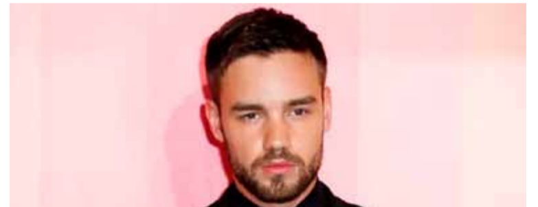
La familia del artista. Pide respuestas