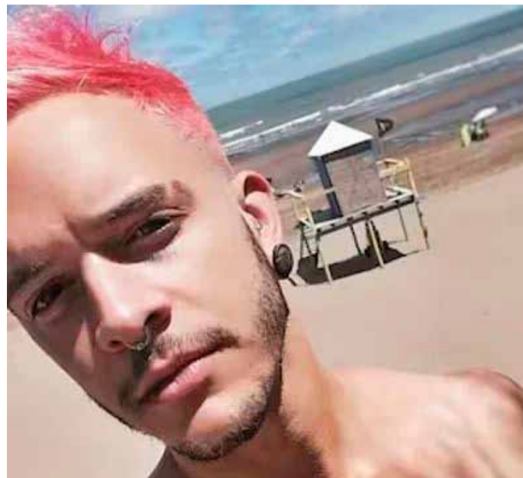
Familiares. Siguen esperando avances en la investigación

Sin embargo, las tres personas lograron ser rescatadas por personal de Prefectura, pero el paradero de Toro se perdió, por lo que se realizó un operativo especial.///