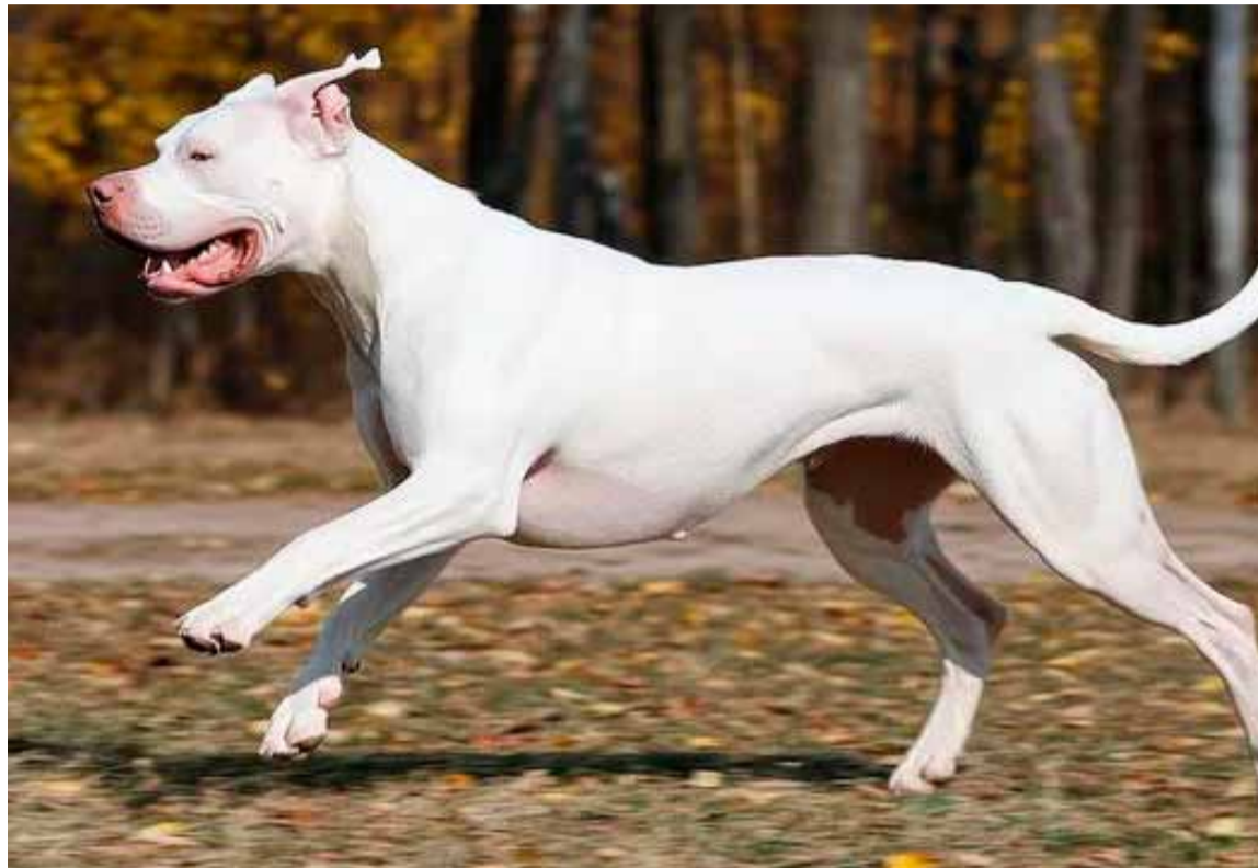
Vecinos. Preocupados por la seguridad en la zona

El perro estaba suelto; la víctima sufrió heridas graves