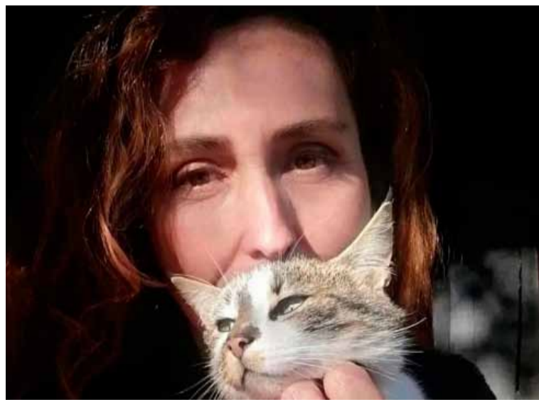
La noticia. Conmocionó a la escena artística nacional