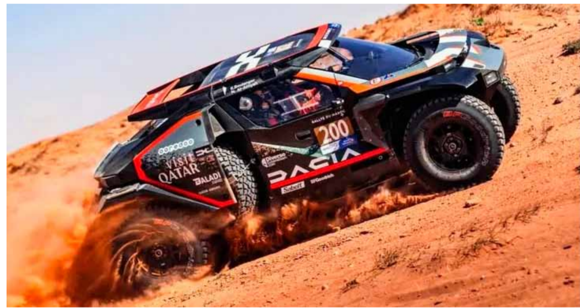
Comenzó la carrera más desgastante en Arabia Saudita

La competencia real comienza este sábado con la primera etapa de 412 kilómetros en Bisha, donde los pilotos enfrentarán sectores de arena y piedras. El manejo estratégico será clave para evitar daños en los vehículos y mantenerse en la lucha.