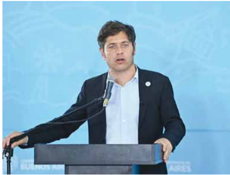
El gobernador Kicillof firmó el decreto, pero continuará negociando con la oposición

También se autoriza al Ministerio de Economía a realizar las adecuaciones pertinentes al presupuesto prorrogado con el fin de dar cumplimiento al artículo 26 del Anexo Único del Decreto N° 3260/08 y sus modificatorios. Y se instruye a esa cartera y a la Agencia de Recaudación (ARBA) a emitir las normas y adoptar las acciones necesarias para la implementación de las disposiciones pertinentes.