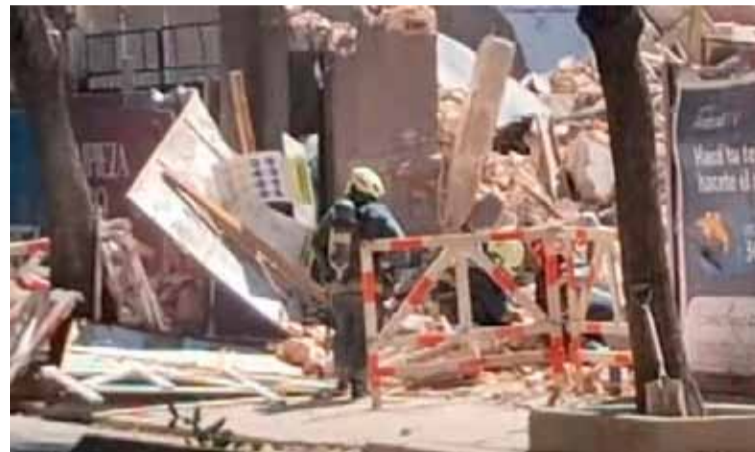
El incidente. Provocó alarma en pleno centro del barrio.

Personal de Metrogas quedó a cargo del operativo tras la tarea de los brigadistas.