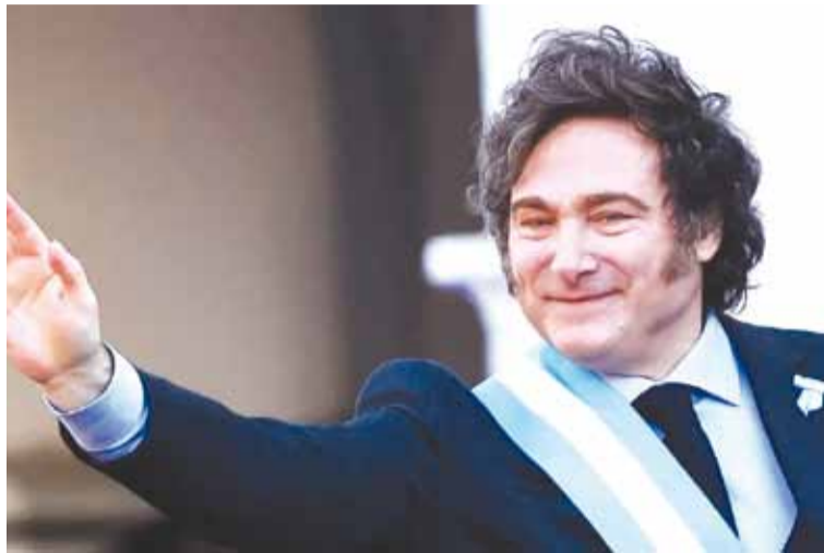
El presidente Milei firmó el decreto correspondiente

texto, “A través de reformas estructurales, la sanción de la Ley ‘Bases y Puntos de Partida para la Libertad de los Argentinos’, y el arduo esfuerzo de cada uno de nuestros conciudadanos, hemos logrado estabilizar el país y hemos comenzado a recuperar las condiciones necesarias para emprender el camino de la prosperidad”.