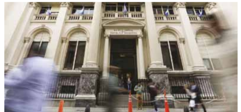
Sede del Banco Central

Explicó que a diferencia de lo ocurrido durante crisis económicas pasadas, la mejora de las reservas líquidas permitió cumplir todas las obligaciones financieras en moneda extranjera del sector público y privado, tanto las previstas para el ejercicio como las correspondientes a impagos acumulados de años anteriores.