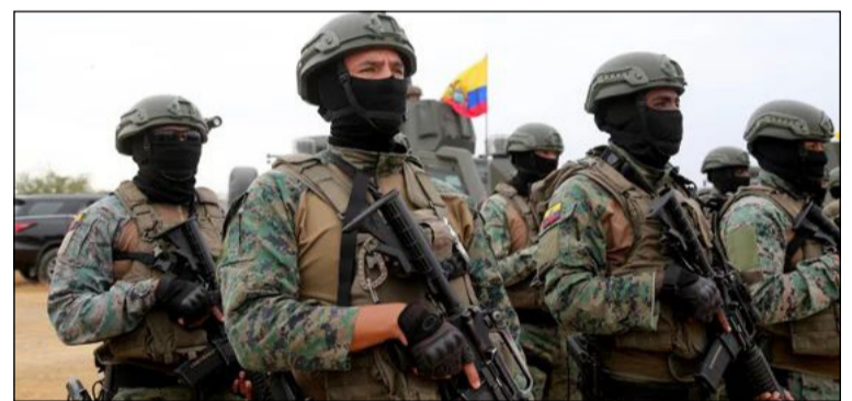
Policías y militares. Patrullan calles en zonas afectadas.

Ecuador libra desde enero de 2024 un "conflicto armado interno" declarado por Noboa contra bandas catalogadas como "terroristas", tras una escalada de la inseguridad y la violencia que azota al país.///