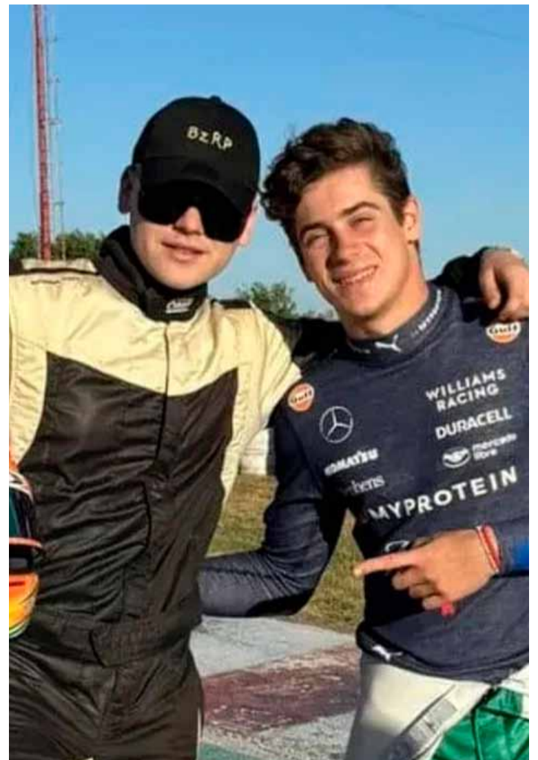
Bizarrap y Colapinto, muy divertidos

Bizarrap fue quien publicó una historia primero en la plataforma digital y bromeó: "Enseñándole un poco". Ante esto, Colapinto comentó: "Lo sacamos piloto al pibe" ironizando acerca del divertido momento vivido.